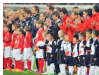
JAHRHUNDERTSPIEL AUF... Wiedersehen mit Freunden