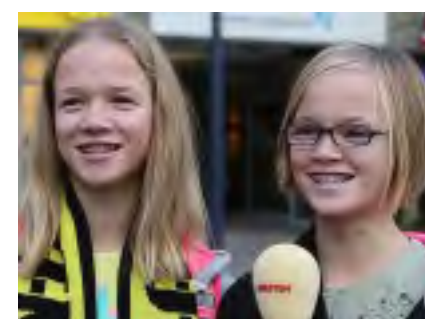
VIDEO Große Erwartungen ans Revierderby